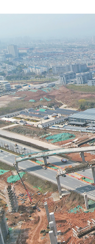
计划总投资10亿元 高端医疗健康产业项目落地义乌

全媒体记者 王婷 本报讯 昨日从市经信局了解到,为进一步优化生物医药产业创新发展环境,我市出台系列奖励、激励政策,主要针对本市注册、具备独立法人资格的从事药品、三类医疗器械、二类医疗器械的生产企业,重点扶持其各类临床研究,支持药品器械转化,助推生物医药产业高质量集聚发展。为鼓励药品生产企业创新研发,我市将对药品上市许可持有人或药品生产企业取得注册批件并在本市产业化的,分阶段给予奖励。如国家创新药(含中药、化学药、生物制品)奖励总额为2000万元,对取得临床批件或备案件的,按该产品实际研发投入的20%予以奖励,最高不超过200万元;取得药监局报产注册受理通知书的,我市将按该产品实际研发投入的30%予以奖励,最高不超过800万元;取得注册批件后补足全部奖励。此外,改良型新药(含中药、化学药、生物制品)、生物类似药(含境内外已经上市生物制品)奖励总额则为1500万元。仿制药(含境外已上市境内未上市)和古代经