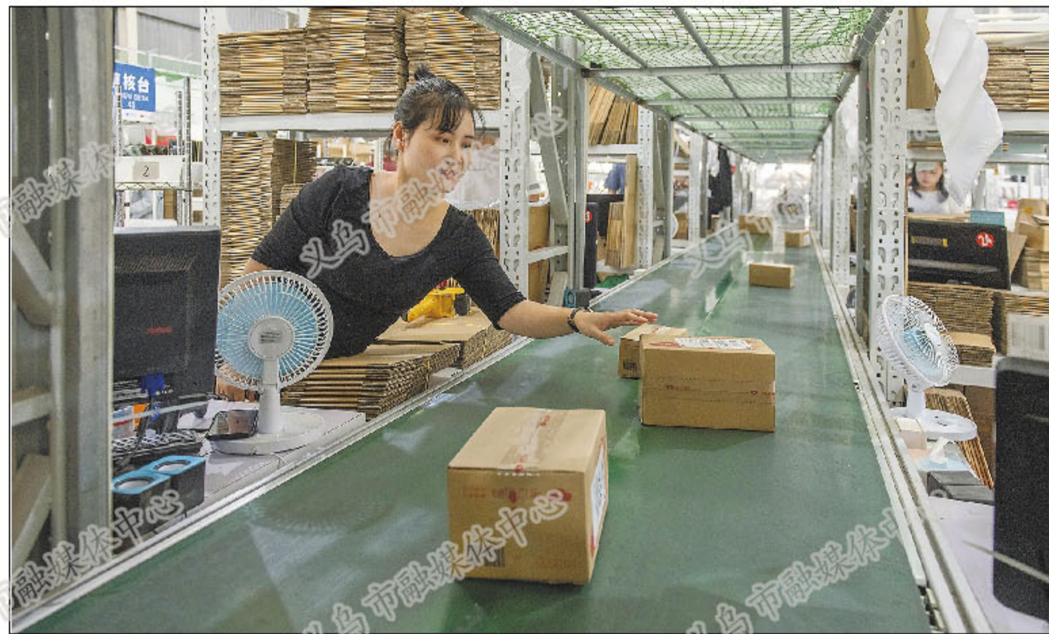
保税物流中心内,采用机械化传送带运送货物,工作效率高。