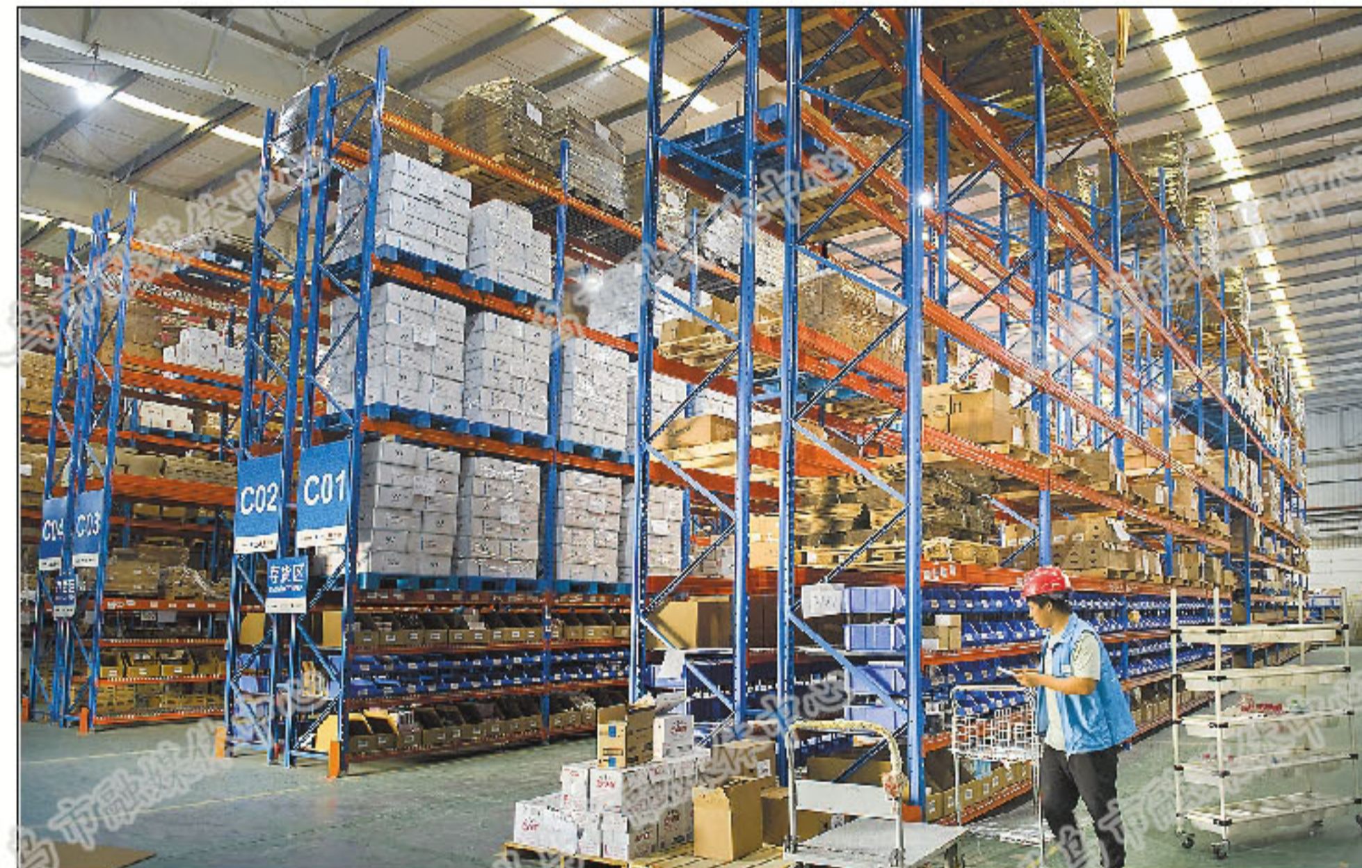
保税物流中心内巨大的仓储仓库。