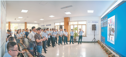
全省“污水零直排区”建设现场推进会

城市发展,供水先行。水是城市发展的生命线,承载着所有人的希望与梦想。 自2014年成立以来,义乌市水务建设集团有限公司始终争当义乌经济发展的先行军,水务事业一路击水弄潮,为商城的快速发展奠定了坚实基础。 近些年,随着经济社会的高速发展,城市用水需求大幅增长。为满足全市日益增长的用水需要,2019年,浦江—义乌供水工程贯通,有效缓解了我市后宅、北苑等地水压过低、水资源紧缺等问题;此外,我市与东阳签订增量引水协议,在原来5000万吨/年引水量的基础上,新增引水3000万吨/年,向“统筹跨区域水资源利用”目标迈出了坚定一步。 在做好境外引水的同时,水务集团加快推进内部挖潜与水厂新建、扩建工作,其中八都水库除险加固工程已于6月正式通水,南山坑水库和窄塘水库扩容工程截至12月累计完成总工程量的30%,城西供水工程、苏溪水厂二期工程、卫星水厂二期工程、上溪水厂二期工程陆续投用,全市制水能力从54万吨/日提升至71万吨/日。 引水需思源,居安要思危。为了节约水资源,破解供需矛盾问题,我市在全省率先推进全域一体化、规模化分质供水。目前,义乌已建成苏福、义驾山、稠江3个分质水厂,卿悦府、向阳府、香悦府3个有机更新区块内小区以及篁园服装市场均已实现分质供水。专家测算,如果义乌全域在建筑冲厕、绿化浇灌、道路冲洗、企业生产等方面全部使用中水,每年至少可置换出30%的优质水,这能很大程度上缓解义乌饮用水紧缺状况。