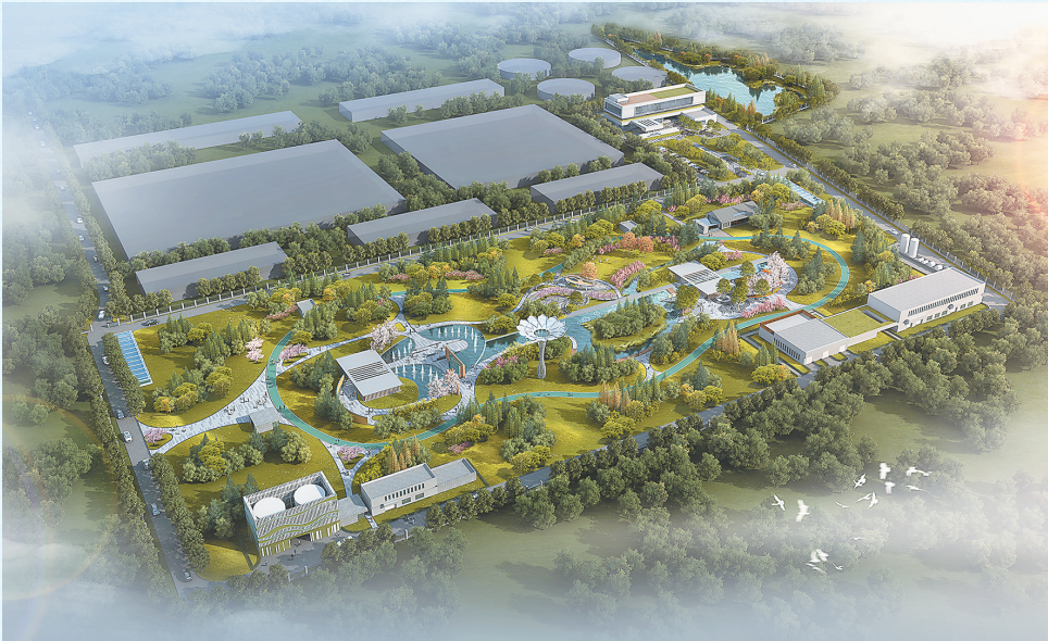
双江湖净水厂效果图

自古以来,水对城市的重要性不言而喻。人们逐水而迁、傍水而居,造就了后来一座座生机勃勃的城市。 据义乌史料记载,秦以前,义乌先民已开始凿井取水,从秦设乌伤县到1963年的2000多年间,义乌县城以义乌江、绣湖水及塘蓄水和井水为饮用水源;1963年,义乌第一家水厂建成,日供水200吨,人们开始用上自来水;时至今日,义乌已拥有9座自来水厂、日供水规模74万方,并合理布局9座污水处理厂,日污水处理能力54万方……这一过程中,水务人始终与水为伍、以水相伴,用一步一个脚印的坚守和付出,维护着整座城市的“水命脉”,守护着每一滴水的七彩阳光。