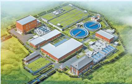
武德净水厂效果图