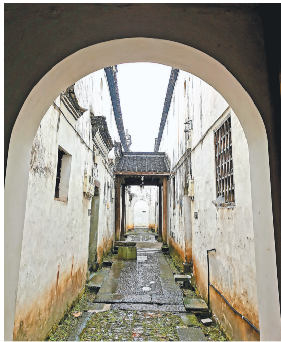
朱店朱宅古建筑群

冷雨淅沥,也抵挡不住文史专家们探故居、怀古人的殷切之心。12月18日,冷风夹杂着毛毛细雨飘落,一支由复旦大学教授、义乌市相关部门负责人、义乌市社科联文史专家以及朱店村代表等组成的专家队伍汇聚赤岸,参加由社科联主办的朱一新文化研讨会。现场,专家们围绕朱一新进行了热烈讨论和分享交流,同时深入挖掘朱一新的优良品质,并结合朱店村的民俗文化、传统建筑等特色资源,推进优秀传统文化的传承与发扬。