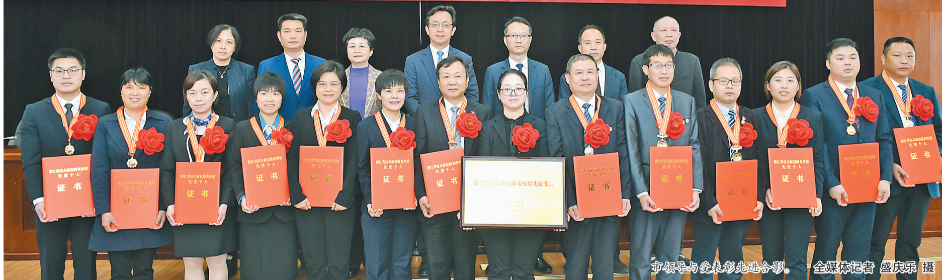
市领导与受表彰先进合影。