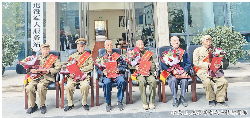
仪式上,志愿军老战士精神矍铄