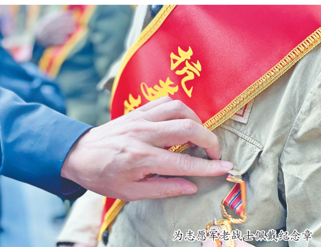
为志愿军老战士佩戴纪念章