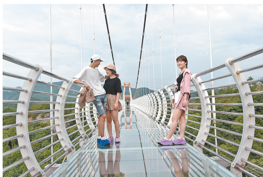
玻璃吊桥上,游人们玩的就是心跳。