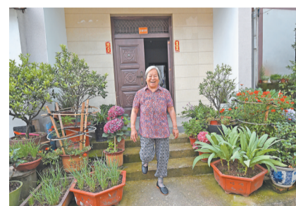
村民生活富足,精神愉快。