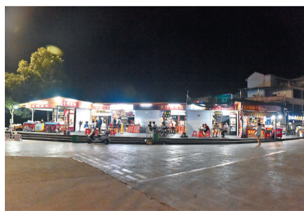
夜晚,游客在村里休闲度假。