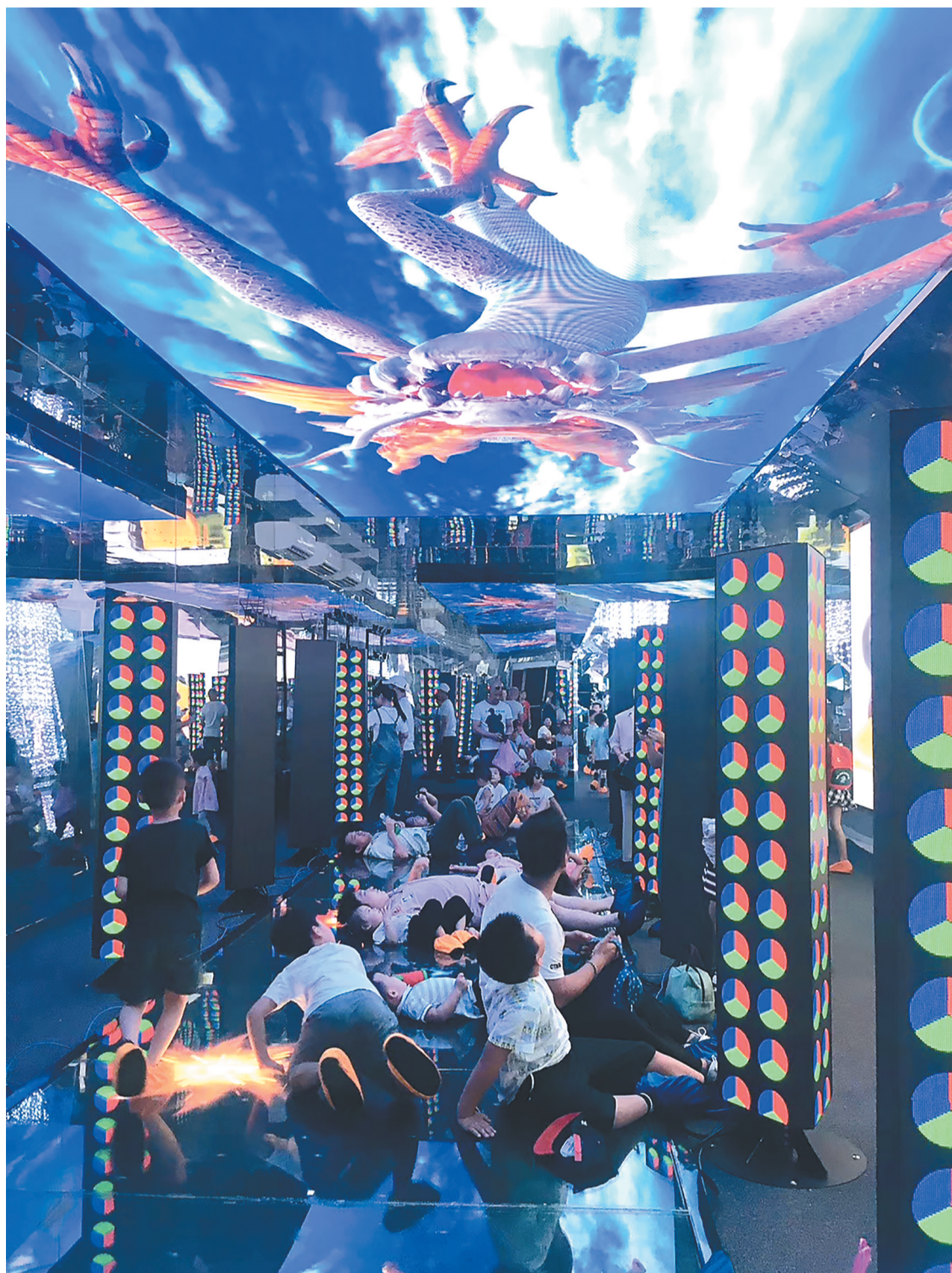
游客身临其境,穿越“时空隧道”景点。