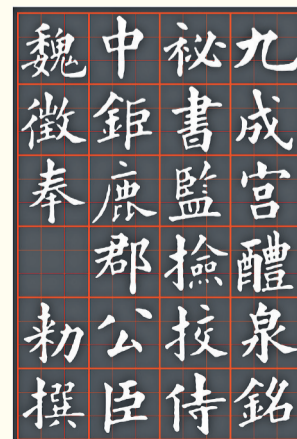
郭儒钊编撰的电子字帖