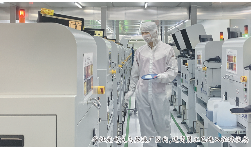
华灿光电义乌苏溪厂区内,返岗员工已进入健康状态