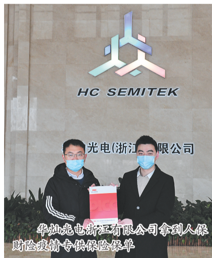
华灿光电浙江有限公司拿到人保财险疫情专供保险保单

上周,人保财险义乌市分公司、平安财险义乌支公司、太平洋财险义乌支公司、大地财险义乌支公司、国寿财险中支公司5家保险分支机构联合定制,针对市内非公企业复工联合设计了这款名为“营业中断保险”的疫情专供产品,可保障企业因法定传染病导致停工停产的损失。义乌版营业中断保险主要面向年纳税规模30万元以上的中小企业,不仅覆