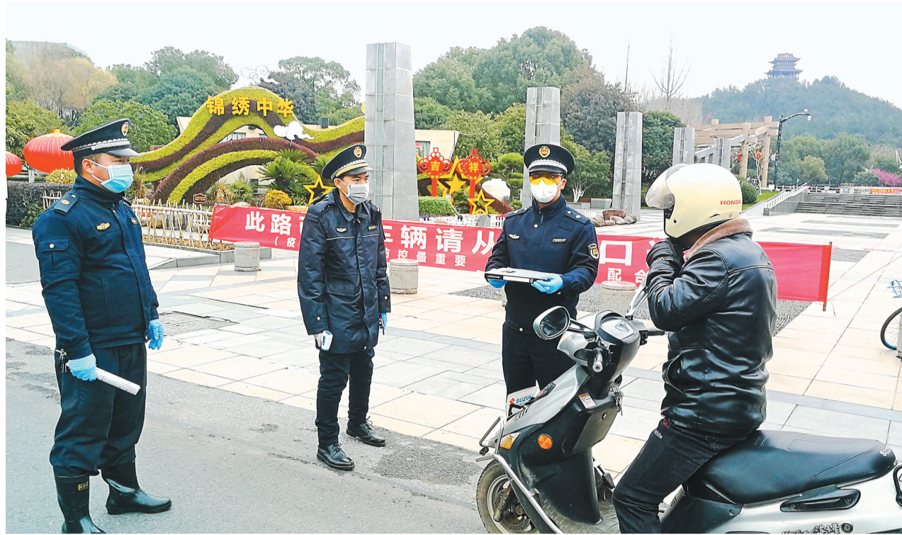
鸡鸣山公园所有入口都已封道,执勤人员正在劝离市民。 2月3日,农历年初十,摄于鸡鸣山公园