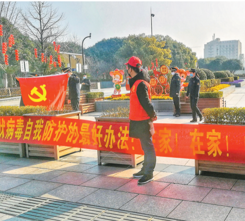
执勤人员牢牢把守公园各入口。 摄于绣湖广场