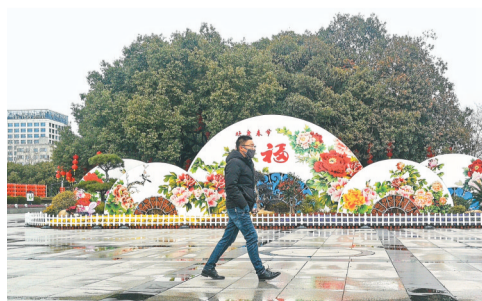
绣湖广场空荡荡的,偶尔来了一位戴着口罩的市民,从“迎新春牡丹花造型雕塑”面前走过,步履匆匆地离开。 摄于绣湖广场