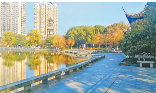
大安寺塔下,只见巡逻执勤人员,游客无影无踪。 2月3日,农历年初十,摄于绣湖公园