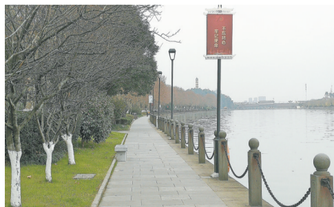
昔日人来人往的江滨公园,这个春节,人迹罕至。 2月6日,农历正月十三,摄于钓鱼矶公园附近