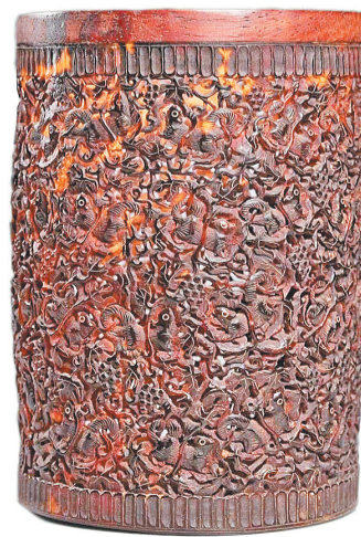
松鼠葡萄纹玳瑁笔筒(清)。

今年是农历庚子鼠年,生肖和地支相配时,鼠和子进行组合,因此,我国民间经常以鼠代子。然而,老鼠长相猥琐,我国人民通常便以尾巴修成长松、长相乖巧可爱的松鼠来代替老鼠。葡萄,结实众多,果实累累,因此,松鼠葡萄纹正代表着多子多福,子孙绵长。这只笔筒便是如此,让人眼花缭乱的松鼠,让人垂涎欲滴的葡萄,正蕴含着子孙兴旺、福祚绵长的寓意。如此珍贵的材料,如此精细的雕工,如此吉祥的寓意,加之岁月的洗礼和时间的沉淀,这只笔筒如今已是价值不菲了。