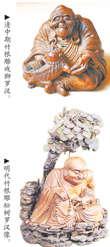
►清中期竹根雕戏狮罗汉。