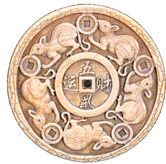
「五鼠运财」象牙挂件(清)。