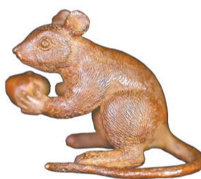
▲鼠抱寿桃铜香插(清)。