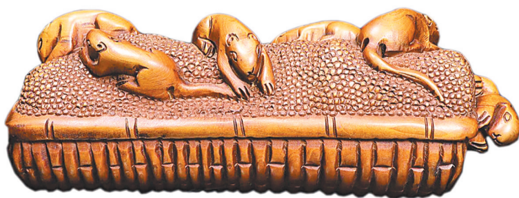
「五鼠运财」黄杨摆件(清)。