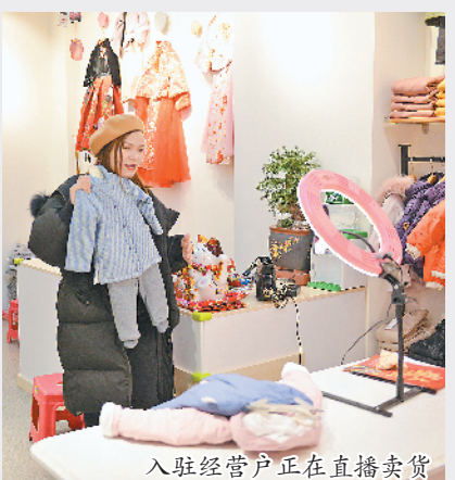
入驻经营户正在直播卖货

示,在确保消防安全的前提下,最大限度放开店铺的装修审批,让各店铺能够根据品牌特色、产品陈列需求进行个性化装修,提升区域经营环境与经营氛围,丰富消费者购物体验。 此外,为提升篁园轻奢生活馆的商业氛围,商城集团篁园市场分公司还设计、制作了LOGO标志标识,不断加深消费者对于市场品牌化、品质化转型的印象,逐步打破消费者对篁园服装市场销售中低端产品的固有印象,也借此鼓励场内商户向品牌化经营转型,更注重产品研发与产品品质、服务的提升。