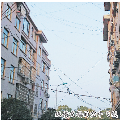
纵横交错的空中飞线

户窗口。记者粗略数了一下,这条约宽百余米的楼体通道之间,至少有约200条各类线路在空中交错,织成了一张让人眼花的“线网”。在随后走访的辖区23幢、27幢之间和15幢、19幢之间的通道后面,同样也发现楼体之间有同样的“线网”。 不仅如此,记者来到一区22幢附近,远远看到有两个类似空调外机样子的箱子斜挂在一楼的墙边,走进一看,原来是“电表箱”(其中一个闪烁着红灯)。其中一个箱体被两根从楼上挂下来的绳子吊着,另一个箱体捆在了楼体煤气管道的固定栓上。继续向前走,在35幢附近,记者看到一个配电箱挂在一根木棍上;在37幢楼体上,两个配电箱悬挂在空中,看上去“摇摇欲坠”。此时,一位路过的居民无奈地说:“这些用绳子吊着的电箱,谁知道什么时候会突然掉下来,要是伤到人,事情就大了。”在19幢与15幢之间的通道边,两根手指粗细的线路快要垂到地面,有人在19幢的楼檐